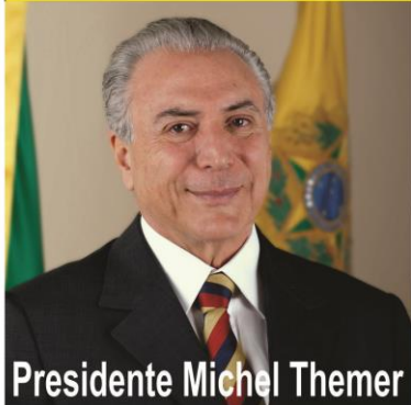
Presidente Michel Temer